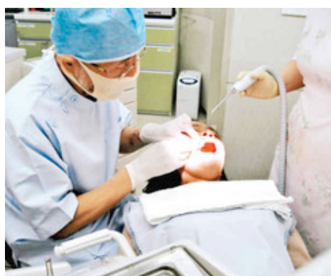
非外科的骨再生療法で歯の汚れ除去を受ける患者＝東京都新宿区のカダデンタルクリニックで

歯を支える骨などが炎症を起こして溶ける歯周病。国民の約七割がかかり、歯を抜く原因の四割以上がこの病気だ。治療や予防に心がけ、いつまでも自分の歯でおいしく食事を楽しみたい。十一月八日は「いい歯の日」。最新の治療法取材した。（鈴木久美子）